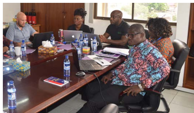
Merci à nos membres pour leurs contributions

Ils ont également convenu de produire un standard de qualité pour le beurre de karité non raffiné.