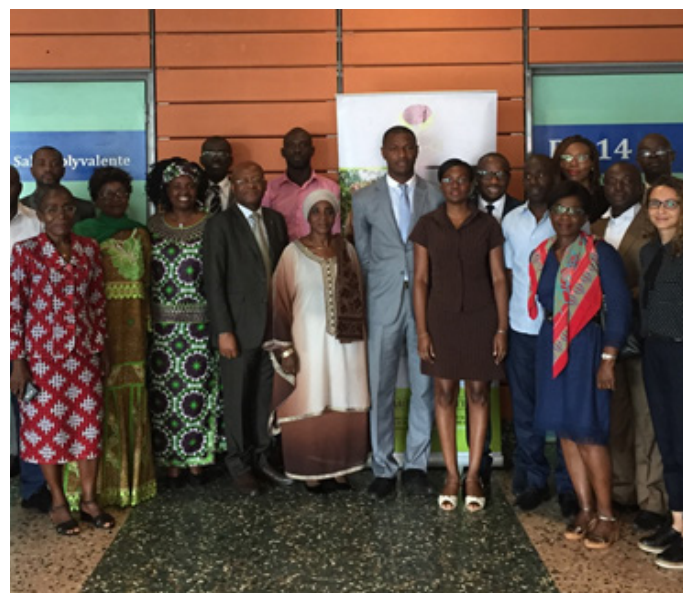
Photo de famille après l'atelier

Le prochain atelier aura lieu au Togo le 14 février.